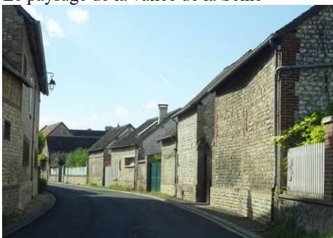
Le bâti associant moellons et briques