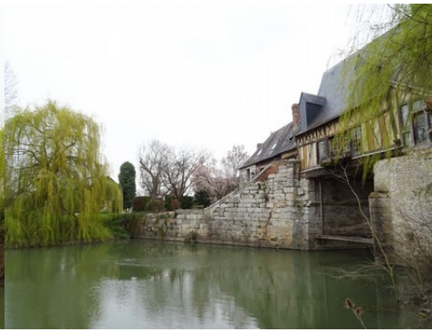
La vue vers la pile et la berge nord