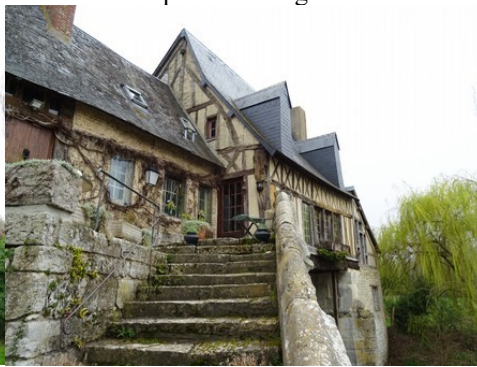
L'escalier d'accès sur la pile nord