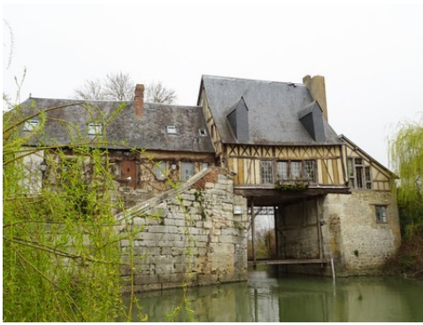
Le moulin enjambant en bras de la Seine