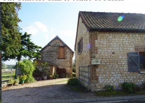
L'entrée d'une ancienne ferme