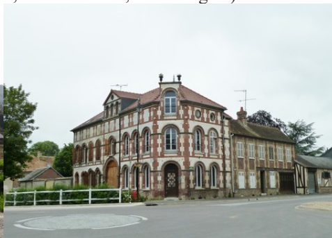
Une demeure dans le centre de Muids