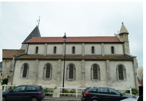
L'église de Muids (inscrite MH)