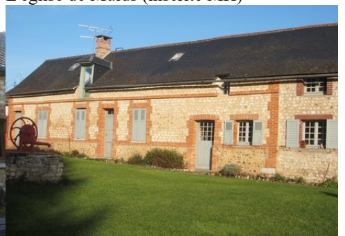
Un exemple d'architecture rurale