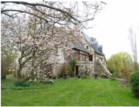
L'accès depuis la berge nord