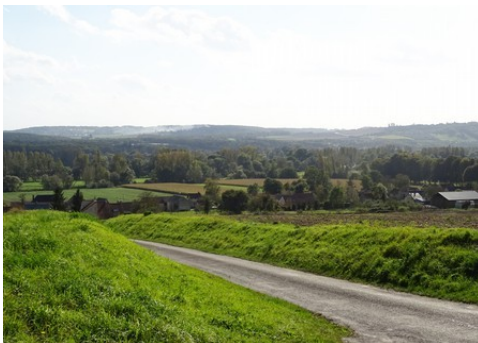
Le paysage de la vallée de la Seine

Les avis seront cohérents avec ceux émis ces dernières années, à savoir : pas de maisons à volume compliqué (type V, W, Y, ou Z), pentes à 45° pour les volumes principaux, ardoise ou tuile plate de teinte brun vieilli, à 20u/m 2 , avec un débord de toiture de 20cm, enduit de teinte beige clair avec modénatures (au choix : chaînages, encadrement de fenêtres, soubassement, colombage...). *Voir les autres fiches.