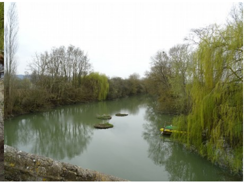
Le bras de la Seine en aval du moulin