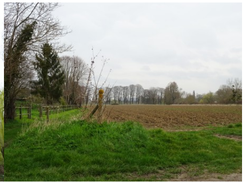
Les champs autour du moulin